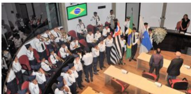
Banda Marcial da Guarda Mirim