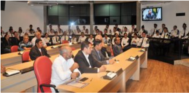
Vereadores e público durante Solenidade