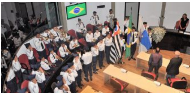
Banda Marcial da Guarda Mirim