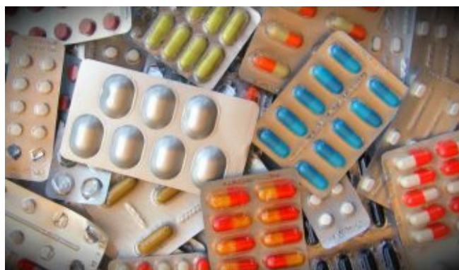
Remédios descartados de forma

Agora é Lei. Farmácias e drogarias de Arujá serão obrigadas a receber medicamentos com prazo de validade vencido. O projeto de Lei nº 043/2017 de autoria do vereador Paulo Henrique Maiolino (PSB), o Paulinho Maiolino , foi aprovado pela Casa e sancionado pelo prefeito José Luiz Monteiro (PMDB). A Lei Municipal nº 2931/17 , publicada em 11/7 no jornal Diário de Arujá, deve ser regulamentada em até 60 dias.