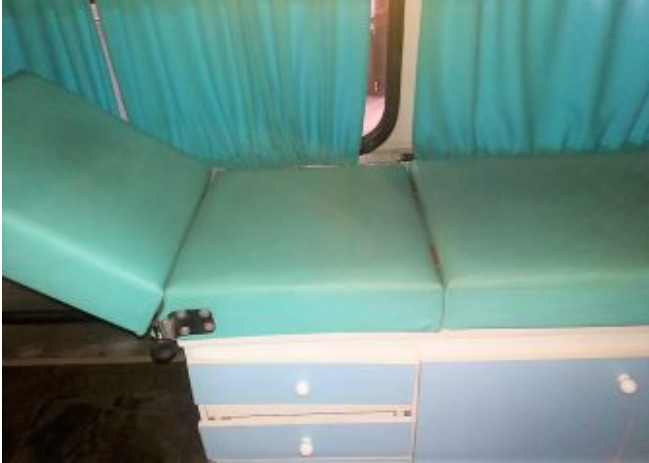
Estrutura interna do ônibus